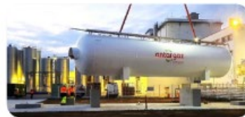
Mise en place d'un réservoir de 100 m 3 à Montauban